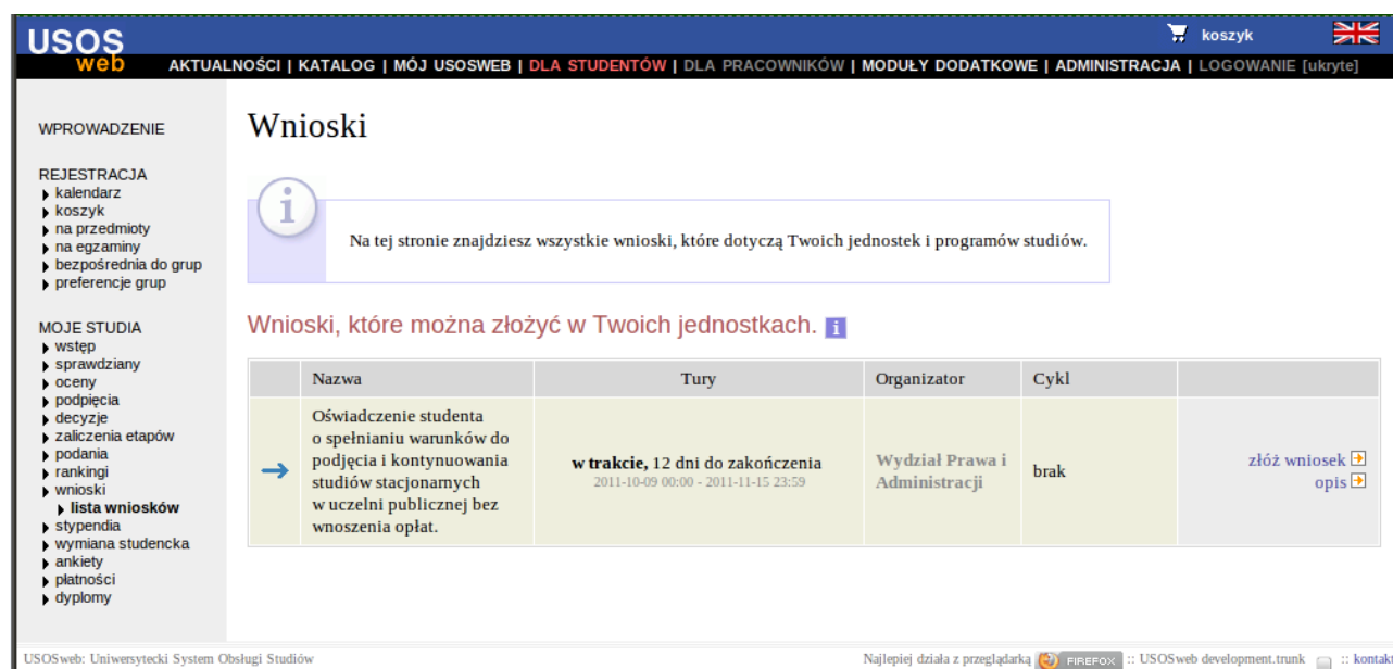
Rysunek 1 Oświadczenie studenta o spełnianiu warunków do studiów bezpłatnych jako wniosek w USOSweb

Student, który chce złożyć oświadczenie wybiera je na liście wniosków, po czym klika złóż wniosek .